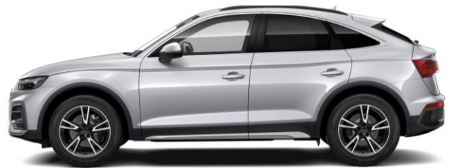
Versión 45 TFSI